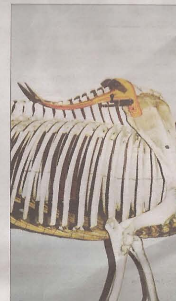
Här ligger sadeln upp på hästens bog. (foto: Peter Winslow)

Peter Winslow ordf i Nordiska Sadelmakarkären